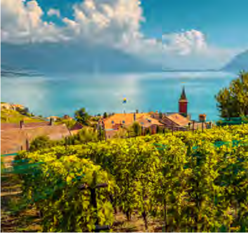
İsviçre'nin enin üzüm bağları boyunca arkadaki Alp manzarası seçilebilir. A backdrop of the Alps can easily be spotted along the vast vineyards of Switzerland.

çikolatasını yudumlayarak kış etkinliklerine katılabilir.